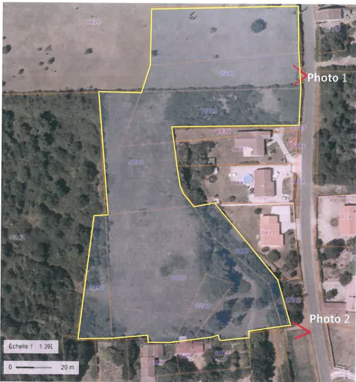
Localisation des prises de vue